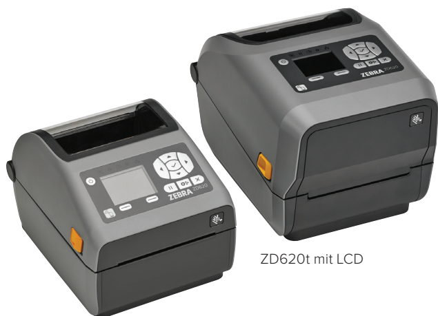
ZD620d mit LCD

Wenn Druckqualität, Produktivität, Anwendungsflexibilität und einfache Verwaltung eine hohe Priorität haben, ist der Zebra ZD620 die erste Wahl. Der ZD620, der die neue Generation der Desktopdrucker-Reihe von Zebra darstellt, löst die beliebte GX-Serie und den ZD500 ab. Mit seiner überragenden Druckqualität und hochmodernen Features bietet er weitaus mehr als herkömmliche Desktopdrucker. Der als Thermodirekt- und Thermotransfer-Modell sowie als Spezialmodell für das Gesundheitswesen erhältliche ZD620 erfüllt eine Vielzahl von Anwendungsanforderungen. Er bietet mehr Standardfunktionen als jeder andere Zebra-Desktopdrucker sowie ein optionales Bedienfeld mit zehn Tasten und LCD-Farbdisplay, das Druckereinstellung und Statusprüfung zum Kinderspiel macht. Der ZD620 nutzt Link-OS® und wird von unserer leistungsstarken Print DNA-Suite mit Anwendungen, Dienstprogrammen und Entwicklertools unterstützt, die durch bessere Performance, einfachere Fernverwaltbarkeit und unkomplizierte Integration für ein überzeugendes Druckerlebnis sorgt. Der ZD620 von Zebra bietet die Druckgeschwindigkeit, Druckqualität und Verwaltbarkeit, die Ihr Unternehmen voranbringt.